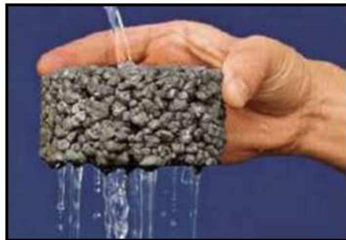
Pavimentos Porosos ou Permeáveis