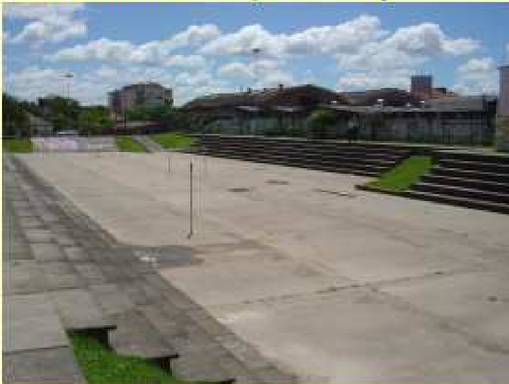
Bacia de Detenção Praça Júlio Andreatta, Porto Alegre – RS'